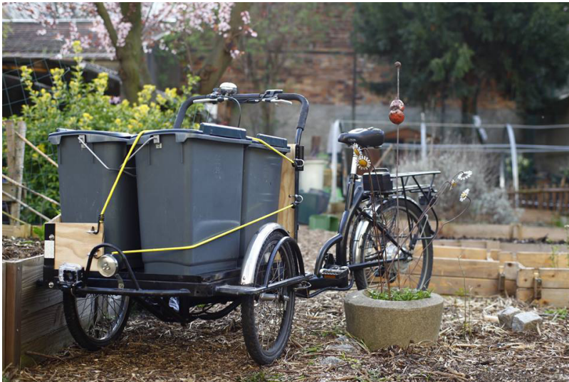
J'aime le vert - jardins partagés du Val de Marne - qui fait partie du guide

Lors de sa dernière réunion, le groupe de travail du guide de création des lieux alternatifs a retenu trois projets sur lesquels il souhaite se concentrer dans les prochains mois :