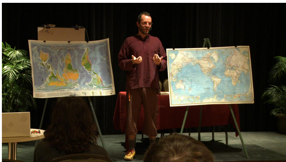
Conférence gesticulée du 16/10/2013 à Québec (Canada)